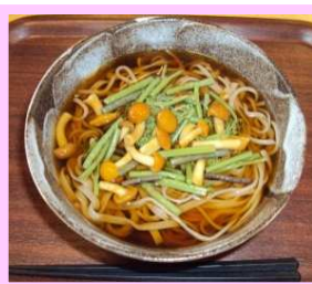
山菜なめこそば 480円

ピーチビレッジのお食事処では新メニューも登場!!ぜひご賞味ください☆ ご要望の多かったラーメン大盛りも始めました~♪